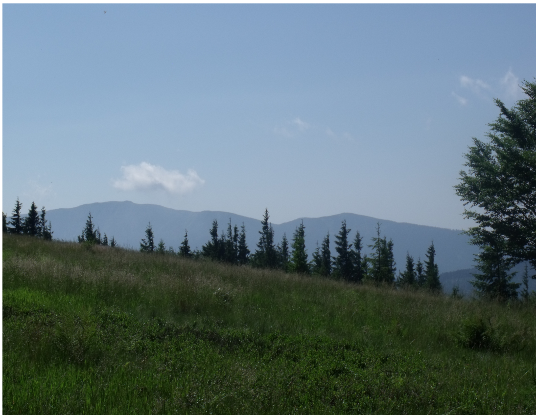
Dalekie widoki z Hali Trzebuńskiej